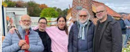
Minister Zuhal Demir opent bakoven Ovenbuur (p. 3)