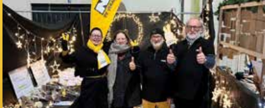
De Warmste Week 2022 (p. 2)