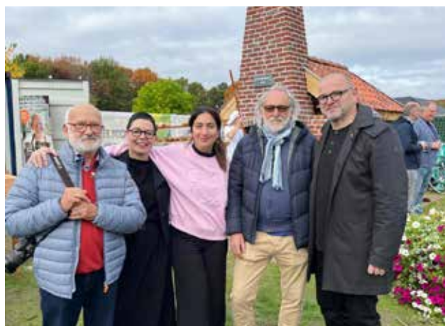
Ook Zuhal Demir stak de handen uit de mouwen.