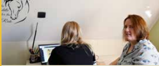
Zorgende bestuursleden vertellen over hun ervaringen (p. 2)