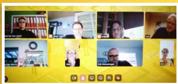
▲ Onze afdeling vergaderde online.