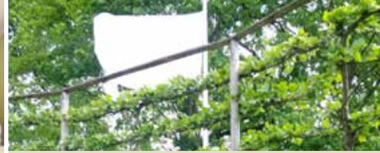
N-VA Bocholt actief tijdens coronacrisis (p. 3)