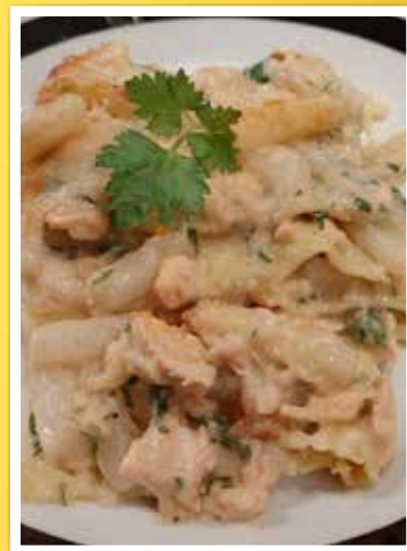
▲ Onze afdelingsvoorzitter deelde wekelijks zijn nieuwe pasta-inspiratie via Facebook.