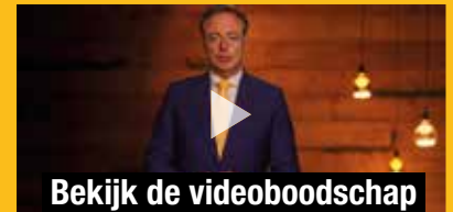
Bekijk de videoboodschap van Bart De Wever

“Na drie jaar van Franstalig-links Vivaldi-beleid dat vooral de belangen diende van niet-werkenden, is de N-VA de enige garantie om onze werkende en ondernemende Vlaamse middenklasse opnieuw te versterken. Maar dan moeten we wel nú, met alles wat we in onze mars hebben, het tij keren. Voor Vlaanderen. Voor welvaart.”